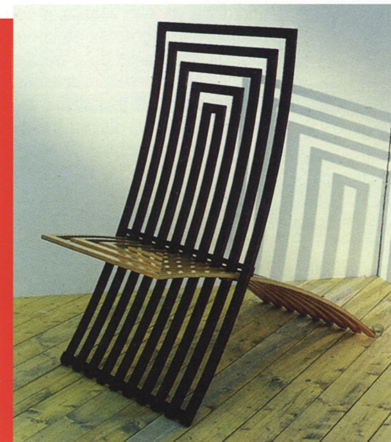
Hollywood chair by B&B Italia