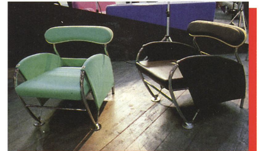
Armchair Numero Uno, design Massimo Iosa Ghini by Moroso

che privilegiavano la componente estetica trascurando la conoscenza approfondita di nuovi materiali e delle loro potenzialità.